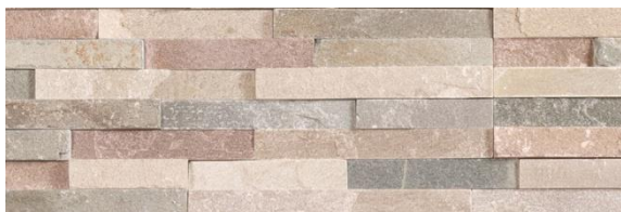
Harvest Mix - kwartsiet