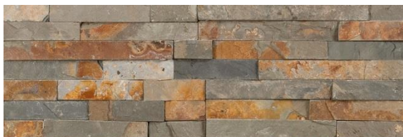
Copper – leisteen