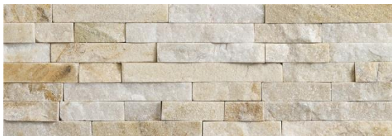
Oyster - kwartsiet